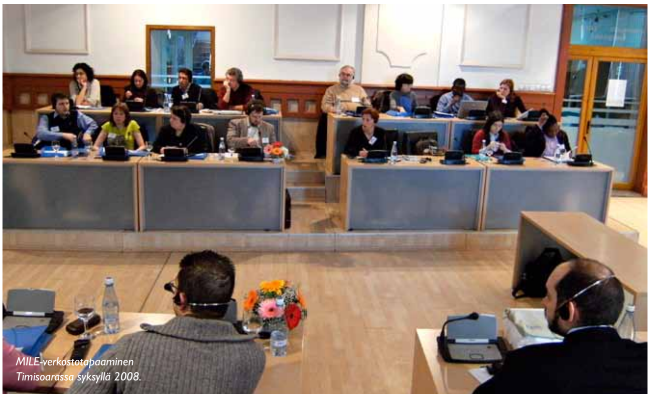
MILE-verkostotapaaminen Timisoarassa syksyllä 2008.

Eurooppalaisen yhteistyön lisäksi Vantaa toimii aktiivisesti Euroopan ulkopuolella. Kaupunki kehittää yhteistyötä Kiinan kanssa monella tasolla erityisesti elinkeinonäkökulmasta. Vantaan kaupungin ja Namibian pääkaupungin Windhoekin yhteistyö on osa Suomen ulkoasianministeriön rahoittamaa pohjoisen ja etelän kuntien yhteistyöohjelmaa. Tavoitteena on kehittää uusia toimintatapoja ja hyviä käytäntöjä kansainväliseen pohjoisen ja etelän väliseen kuntayhteistyöhön, tukea kuntien kansainvälistymistä sekä koota tietoa paikallishallinnosta ja julkisten peruspalvelujen tuottamisesta. Vantaa on saanut ideoita mm. nuorten osallistamiseen ja kirjaston yhteisöllisyyden lisäämiseen.