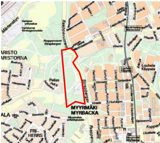
Asemakaavan muutosalueen sijainti ja alustava rajaus.

Vantaan kaupungin yrityspalvelut hakee maanomistajana yleiskaavan mukaista kerrostalorakentamista Uomatien länsipäähän Raappavuoren alueelle.