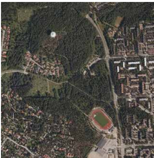
Ilmakuva kaavamuutosalueelta. Nykytilanne.