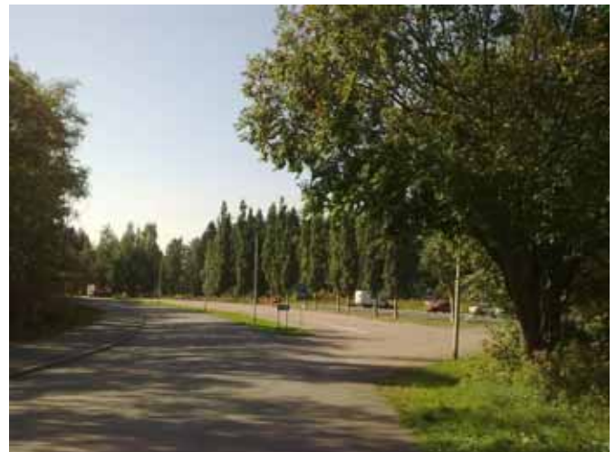
Näkymä Raappavuorentieltä Uomatielle.