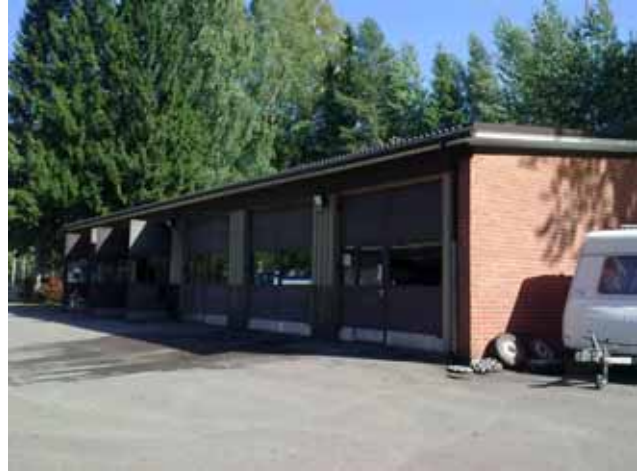
Myyrmäen huollon varistorakennus, Uomatie 24.