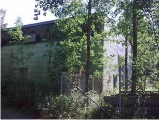
Vantaan Energian varistorakennus, Uomatie 22.