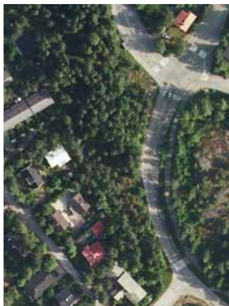
Ortoilmakuva vuodelta 2009.