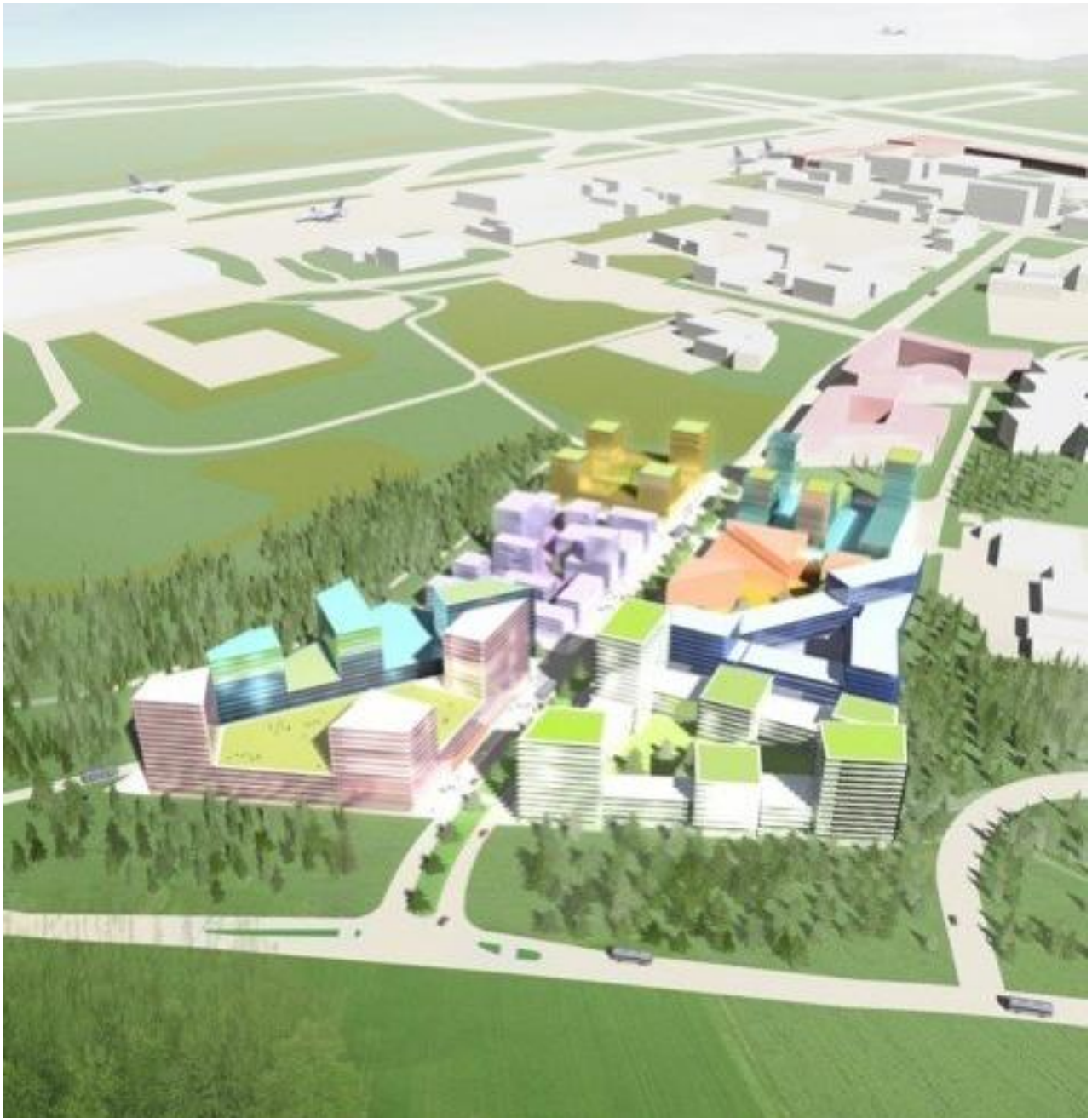
Havainnekuva alueen mahdollisesta massoitelusta, Helsinki Zurich Office Oy

Tavoitteena on luoda elävä ja urbaani kaupunkikeskus, joka tukeutuu Aviapolis-aseman erinomaisiin joukkoliikenneyhteyksiin, ja luoda edellytyksiä kevyelle liikenteelle sekä alueen sisällä että sen ulkopuolelle. Asukkailla tulee olla realistinen mahdollisuus elää alueella ilman yksityisauton omistamista.