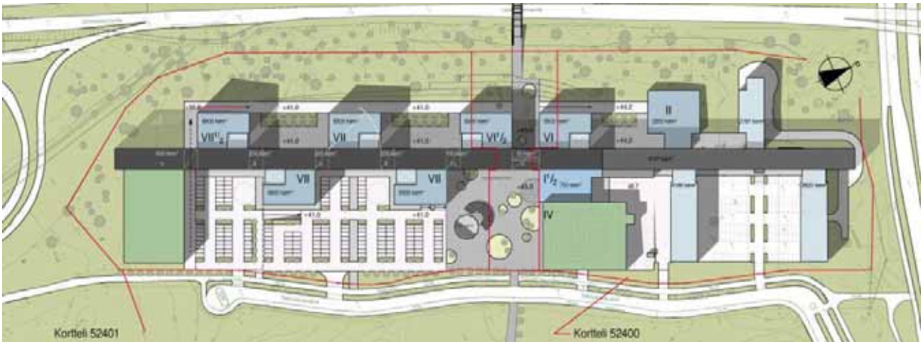
IDEALUONNOS, Arkkitehtitoimisto Larkas & Laine Oy