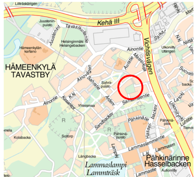
Sijainti ja suhde kaupunkirakenteeseen.