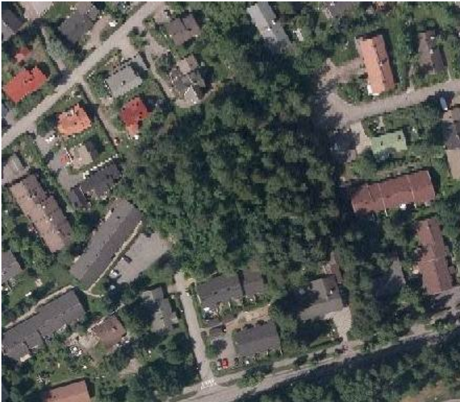
Ortoilmakuva vuodelta 2013.