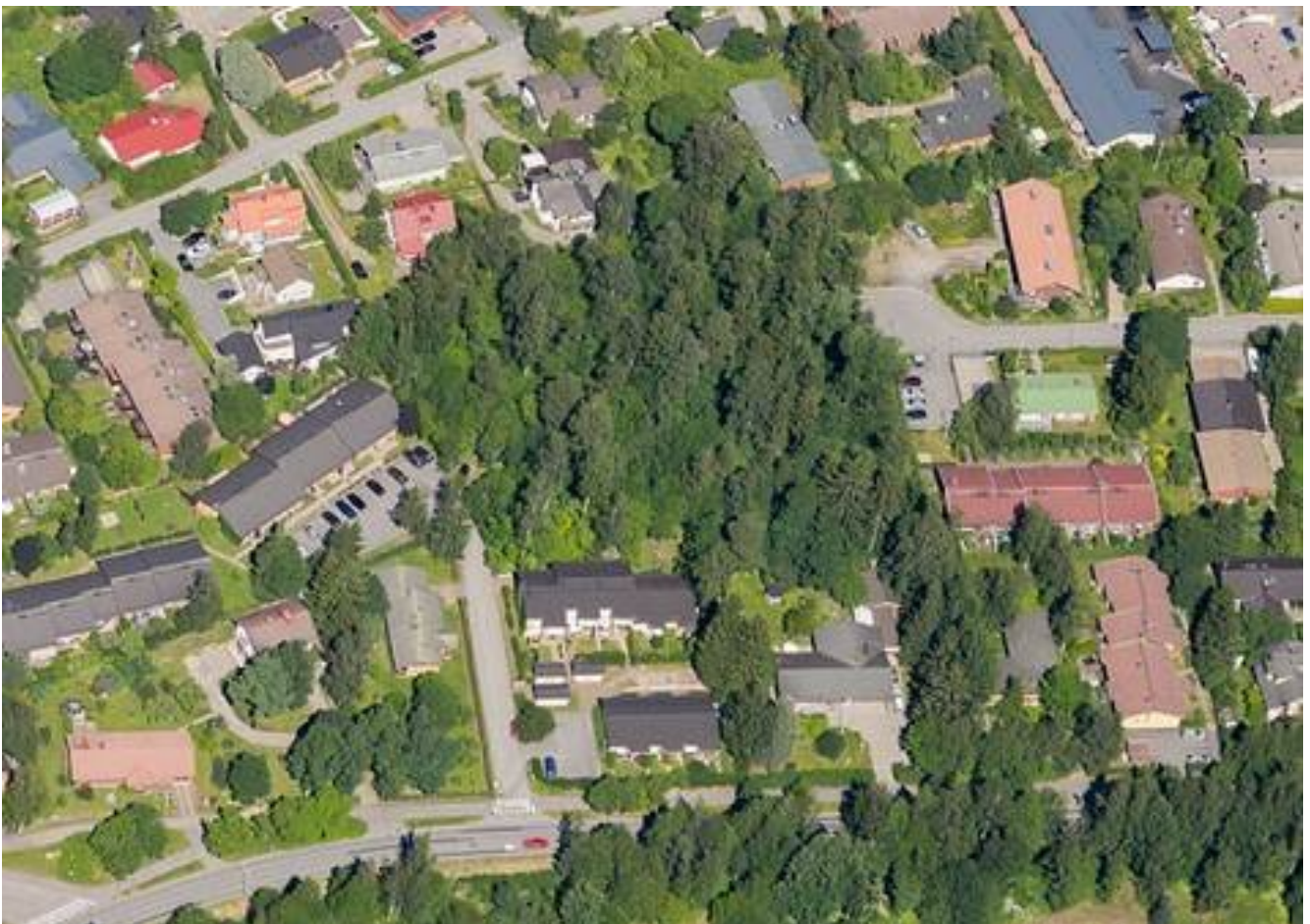
Viistoilmakuva vuodelta 2014.

Mielipiteet ja tavoitteet pyydetään 1.4.2015 mennessä jäljempänä esitetyllä tavalla.