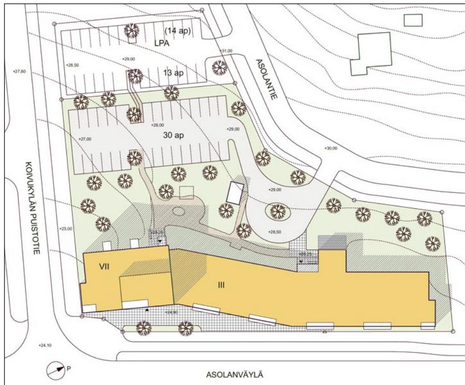
Esisuunnitelma alueen käytöstä (Ulpu Tiuri) 1:1000