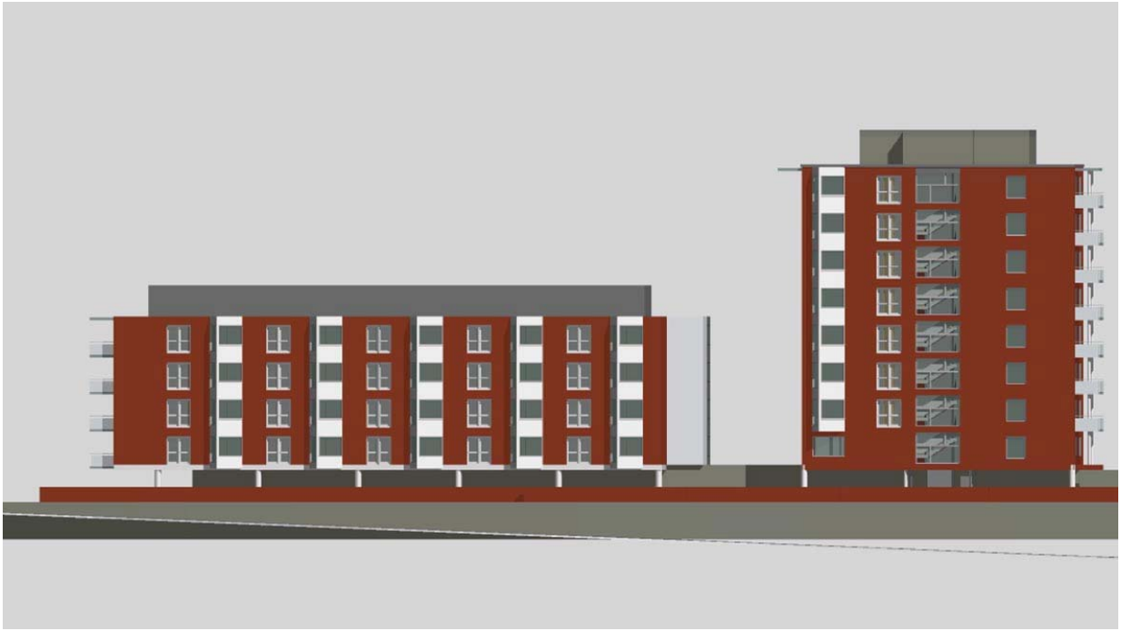
Alustava suunnitelma / Tuula Fleming julkisivu Peijaksentielle