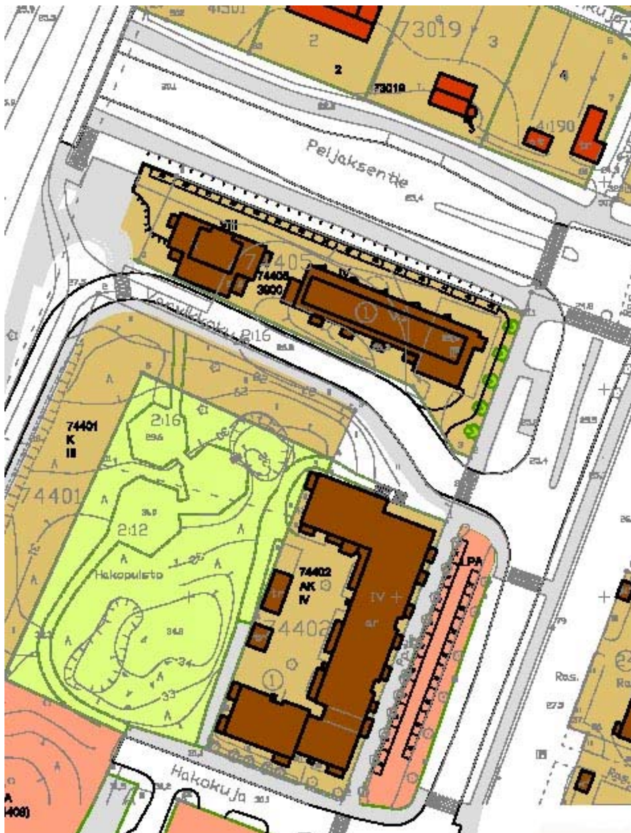
Alustava suunnitelma / Tuula Fleming asemapiirustus