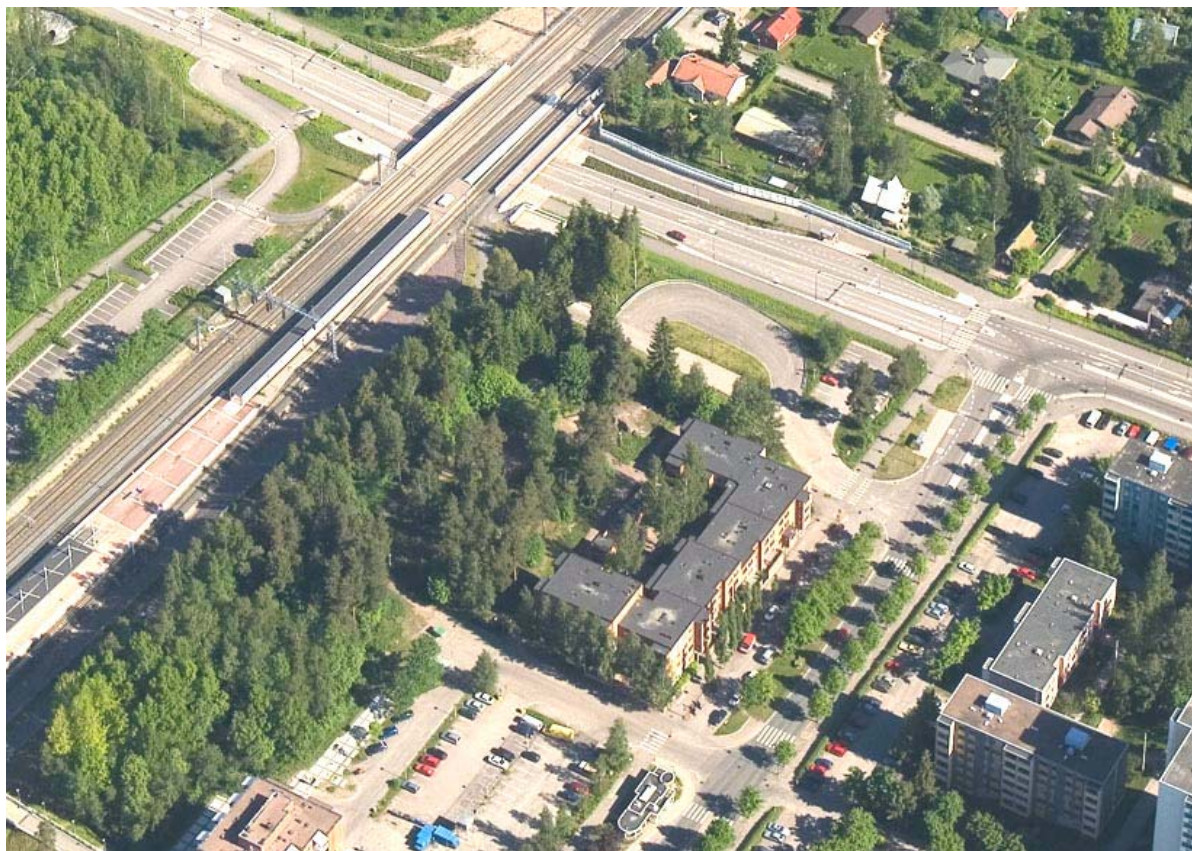
Viistoilmakuva vuodelta 2007.