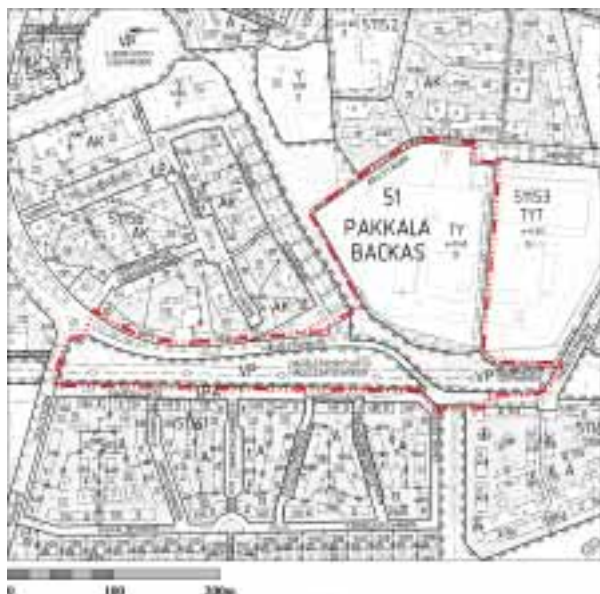
ALUSTAVA ASEMAKAAVAMUUTOKSEN RAJAUS

rakennusten korttelialuetta, jolla tehokkuusluku on e = 0,60 ja rakennusten korkeus saa olla enintään 10 m.