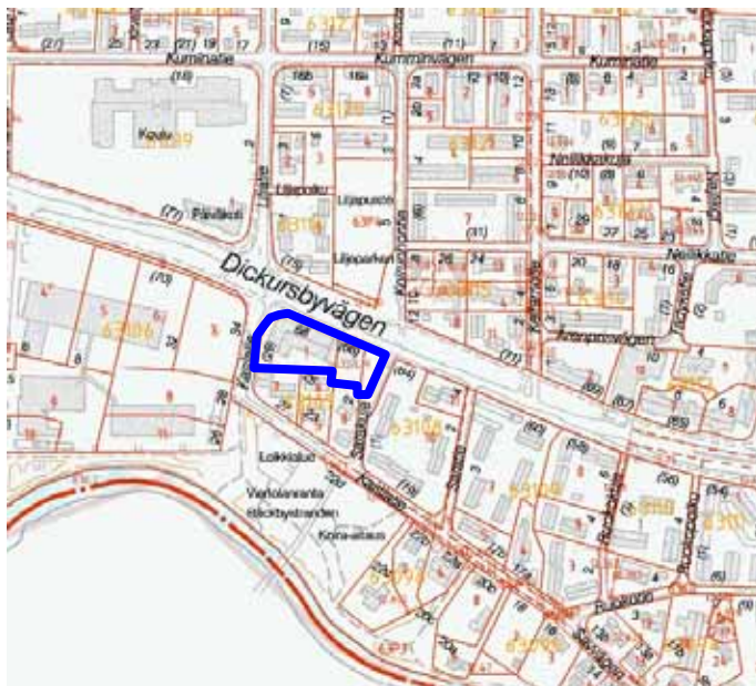
Kartta muutosalueen sijainnista

Suunnittelualue sijaitsee Viertolassa Kaislatien ja Sarakujan välissä Tikkurilantien eteläpuolella.