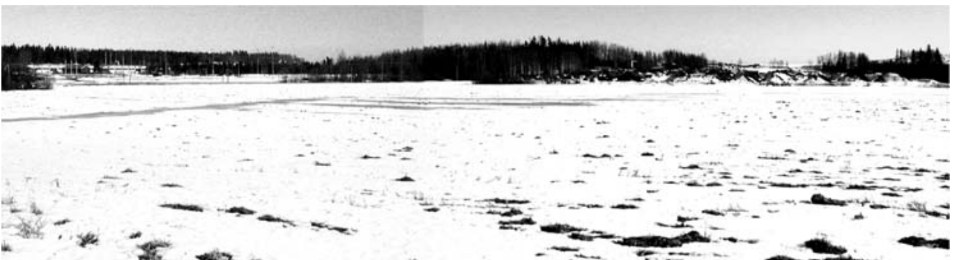
Näkymä kohti moottorirataa Päivölän suunnasta.

Vantaan kulttuurimaiseman ja rakennetun ympäristön suojeltavat ympäristökokonaisuudet. Vantaan kaupunki 1991.