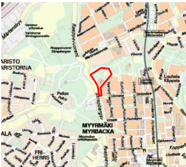
Asemakaavan muutosalueen sijainti ja alustava rajaus.

Vantaan kaupungin yrityspalvelut hakee maanomistajana yleiskaavan mukaista kerrostalorakentamista Vaahtokujan pohjois- ja Raappavuorentien itäpuolelle.