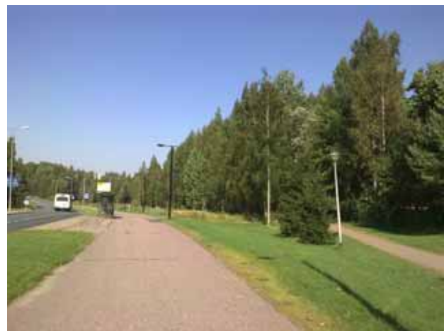
Näkymä Raappavuorentieltä Uomatien risteyksestä pohjoiseen.