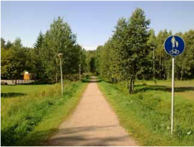
Vahtokujan päästä lähtevä polku.