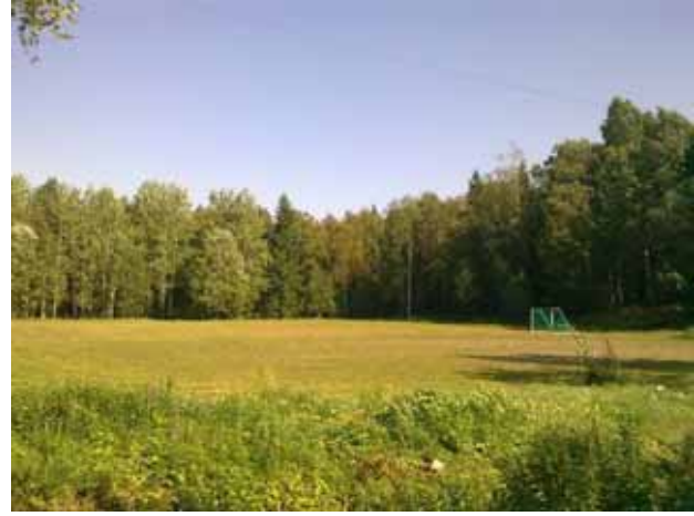
Vahtokujan päässä oleva pallokenttä.