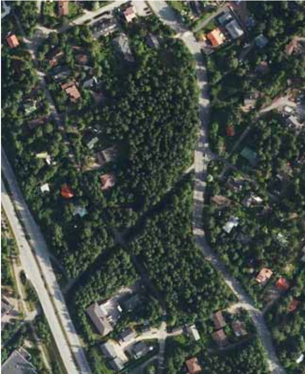
Ilmakuva kaavamuuotosalueelta. Nykytilanne.

► Tavoitteita, kannanottoja ja mielipiteitä kaavoitukselle voi esittää 27.10.2010 mennessä - kirjallisesti osoitteella Vantaan kaupunki, kaupunkisuunnittelu, Timo Kallaluoto, Kielotie 28, 01300 VANTAA - sähköpostilla timo.kallaluoto@vantaa.fi - puhelimitse (varmimmin 30.9. ja 12.10. klo 12-13) p. 8392 2675. Samalla pyydetään ilmoittamaan nimenne, osoitteenne sekä asemakaavamuutoksen numero 002111 .