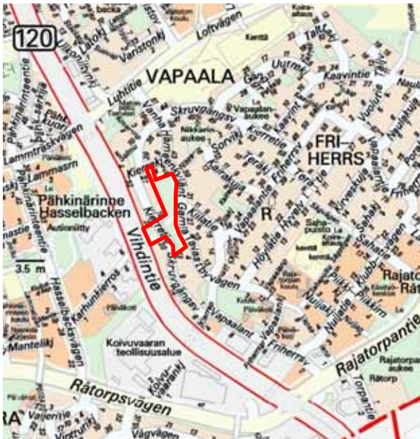
Asemakaavan muutosalueen sijainti.

Vantaan kaupungin yrityspalvelut hakee omakotitonttien kaavoittamista Vapaalaan Kierretie 15 - 17:n ja Vanha Hämeenyläntie 4d- kohdalle Hohtimet-nimiseen puistoon. Kyseessä on yleiskaavan mukainen täydennysrakentamiskohde.