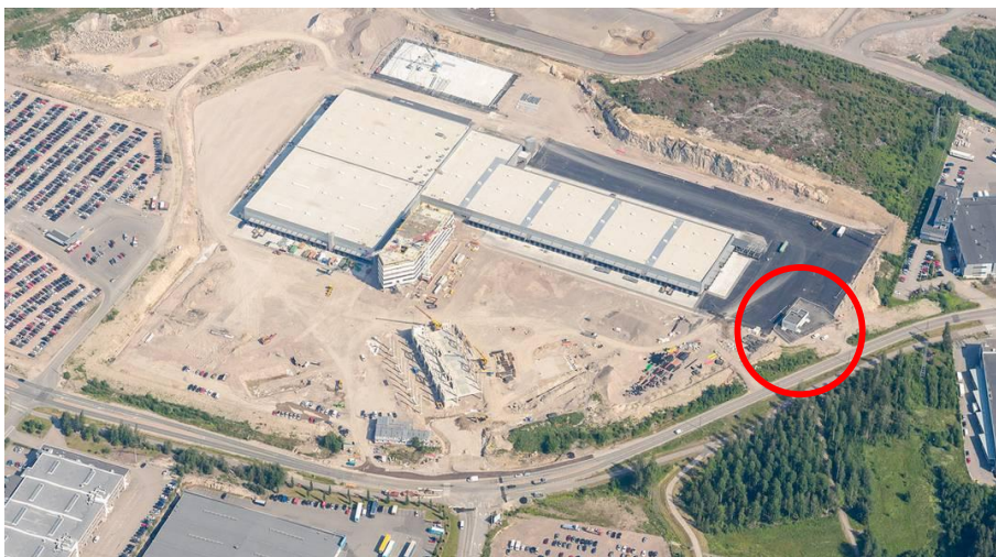
Uusin ilmakuva vuodelta 2014. ○ Kuilurakennus.