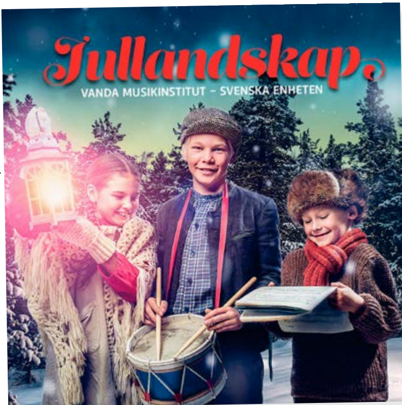
Musikinstitutet ger ut skivan Jullandskap den 9.12.

Grafiker: Christian Aarnio