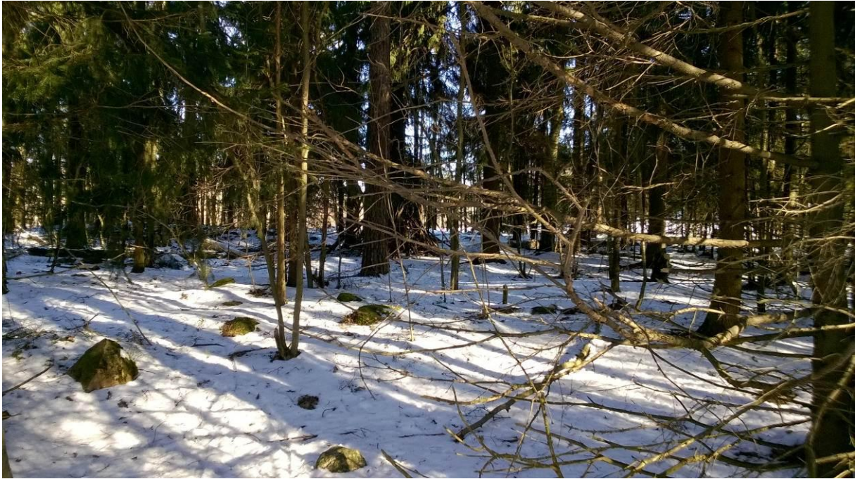
Metsää kaava-alueen eteläosassa. Tulevaa rakentamisaluetta.