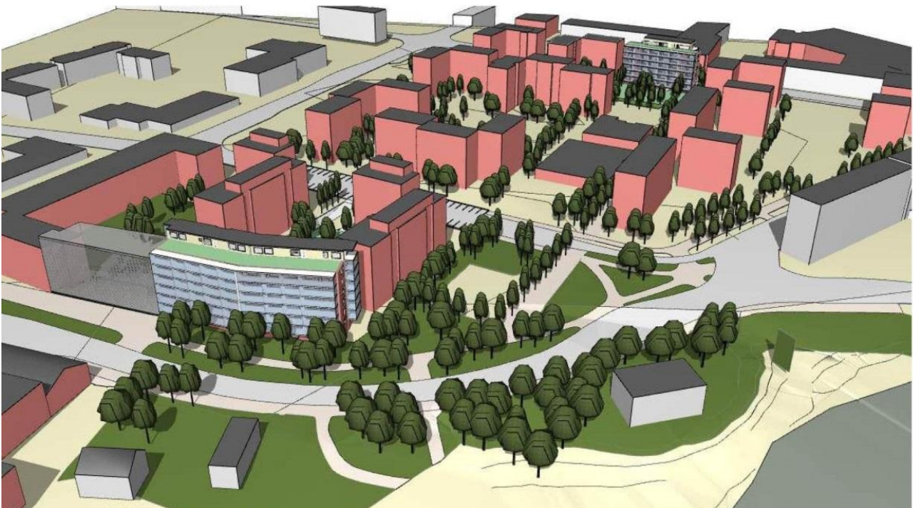
Kukkaketo nähtynä etelästä. Etualalla on Tikkurilantien reunaan kaavailtu rakennus. Sen jatkeeksi on ideoitu uutta rakennusta (harmaalla) Tikkurilantie 53:een. Se ei kuitenkaan sisälly tähän kaavamuutokseen

Osallistuminen järjestetään suunnittelun eri vaiheissa mm. asettamalla suunnitelma nähtäville ja lausunnoille.