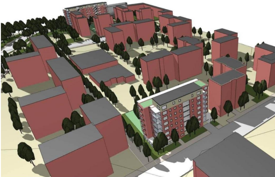
Näkymä Unikkotien suunnasta,