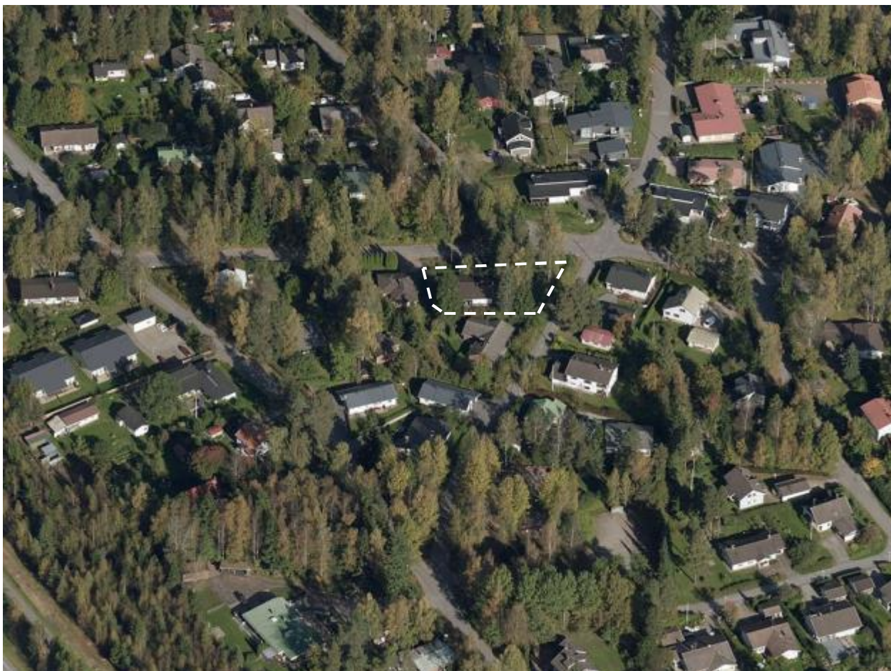
Kaavamuutosalueen rajaus viistoilmakuvalla.

Kaavamuutosalue sijaitsee Kivistön kaupunginosassa Kivistöntien ja Marmorikujan risteyksessä.