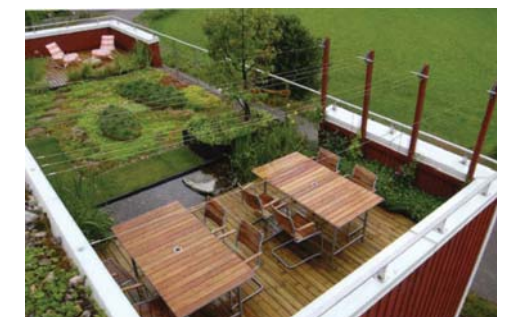
Pysäköintitalon katto otetaan yhteisoleskelukäyttöön. Sinne on asukkailla pääsy pysäköintitalon portaita pitkin.