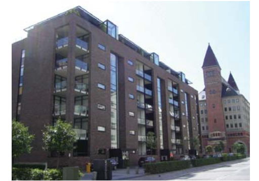
Ruusukvartsinkadun ja Vanhan Nurmijärventien varrella parvekkeet ovat sisäänvedettyjä tai ranskalaisia parvekkeita.