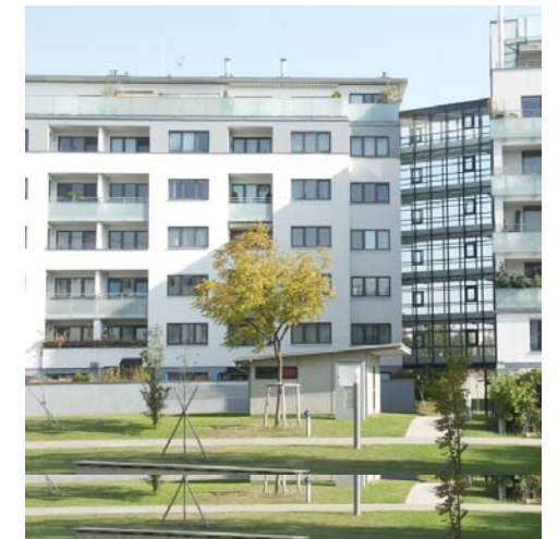
Rakennusten sijoittaminen tontin laidolle tekee pihalueista laajoja ja valoisa