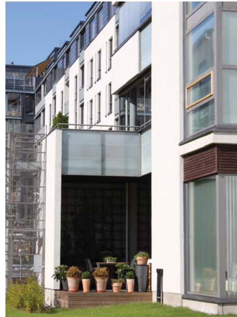
Maantasokerroksiin on sijoitettu asuntoja pihan puolelle apikkoihin, jotka ovat ilmansuunnallisesti edullisimmat