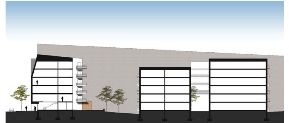
Vanhan Nurmijärventien laidalla rakennus on harjakattoinen

Jätehuolto järjestetään keskitetyn keräysjärjestelmän avulla. Keräyspaikkoja, joita järjestetään tarvittava määrä, sijoitetaan kulkureittien varsille siten, että saavutetaan erilaiset käyttäjäryhmät parhaalla mahdollisella tavalla.