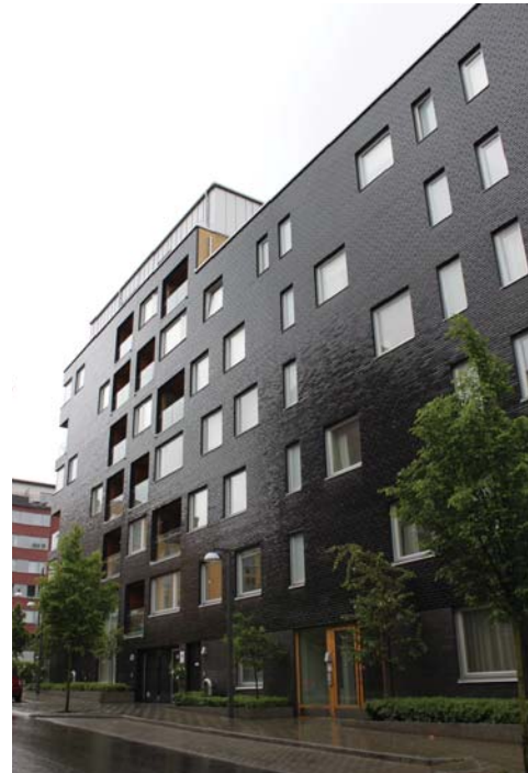
Ruusukvartsinkadun varrella rakennukset sijoitetaan kiinni katuun