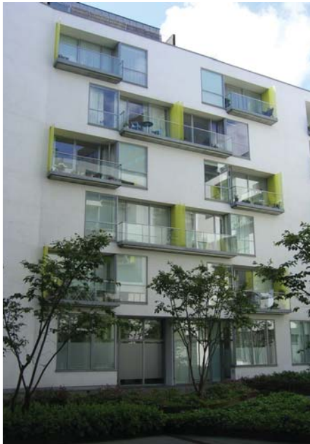
Sisäpihat ovat pääosin vaaleaksi rapattu tai pinnoitettuja betonielementtejä

Rakennukset sijoitetaan kiinni myös asema-kaavassa olevaan, tonttia halkovaan, kaaren osaan, niin että kaaren muoto hahmottuu.