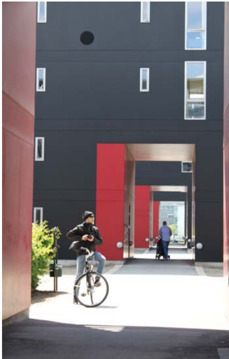
Tontin halkaisee Taideakseli, jonka ylle sijoituu viereisten rakennusten parvekkeet