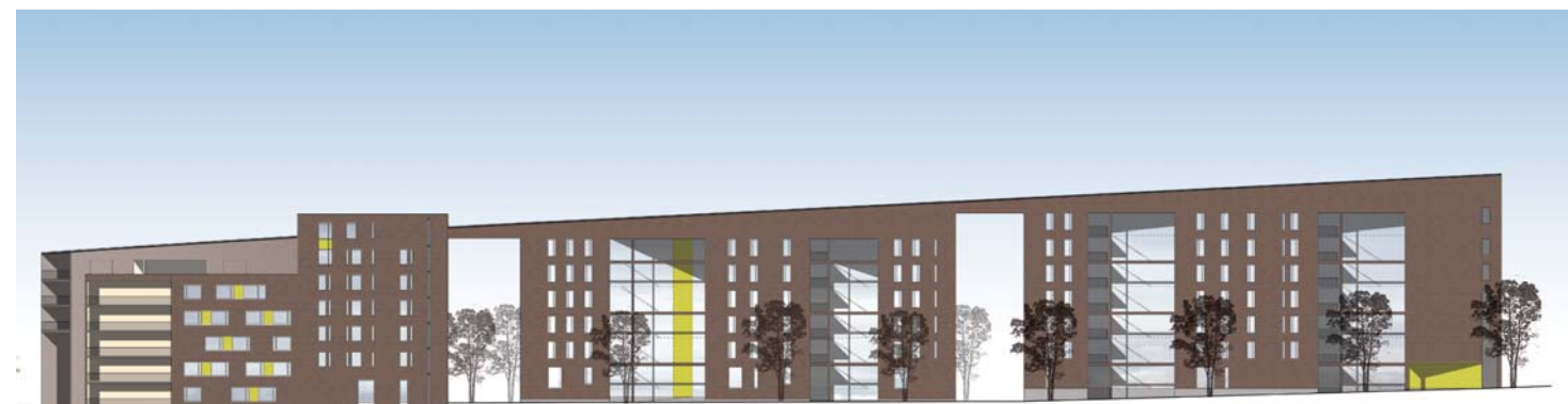
Ruusukvartsinkadun puolella tiilimassa laskeutuu yksimassaisena kohti Promenadia