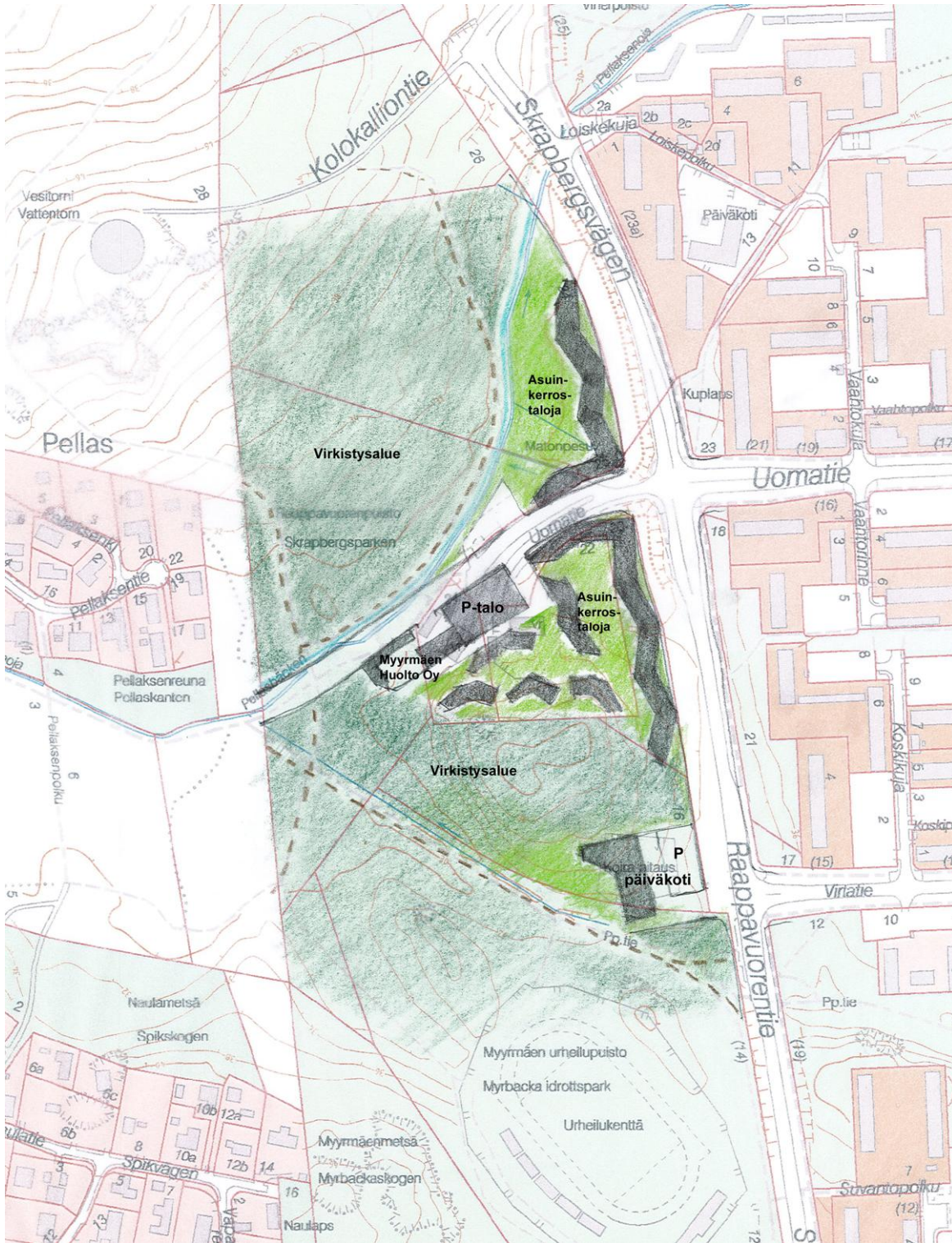
Alustava luonnos maankäytöstä