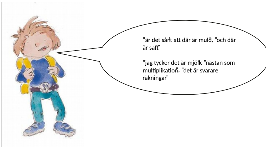
Barn i förskoleåldern svara på frågan "Vad är multilitteracitet?"

Barnen övar multilitteracitet i nära växelverkan med andra barn och personalen. Tyngdpunkten i förskoleundervisningen är att tolka olika sociala situationer och att komma överens med andra. Under förskoleåret övar barnen sig i att tolka och läsa människors miner och gester samt att lösa problem som uppstår i olika situationer. Förskolegruppen diskuterar och funderar tillsammans hur viktigt det är att kunna läsa olika situationer och meddelanden för att kunna komma överens med andra människor.