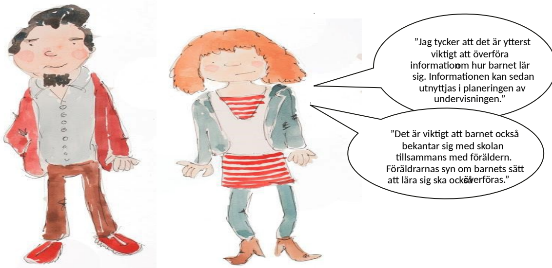
Föräldrarnas åsikter om samarbetet vid övergångarna

I den lokala läroplanen ska fastställas och beskrivas: