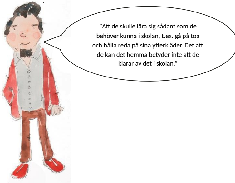
Förälderns svar på vad vardagskompetens kunde innebära