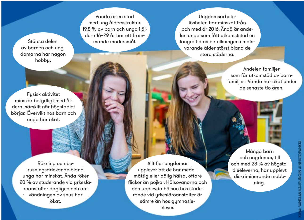
Bild 1. information om barn och unga i Vanda och deras välfärd

Mer information om välfärden bland barn, unga och barnfamiljer i Vanda: