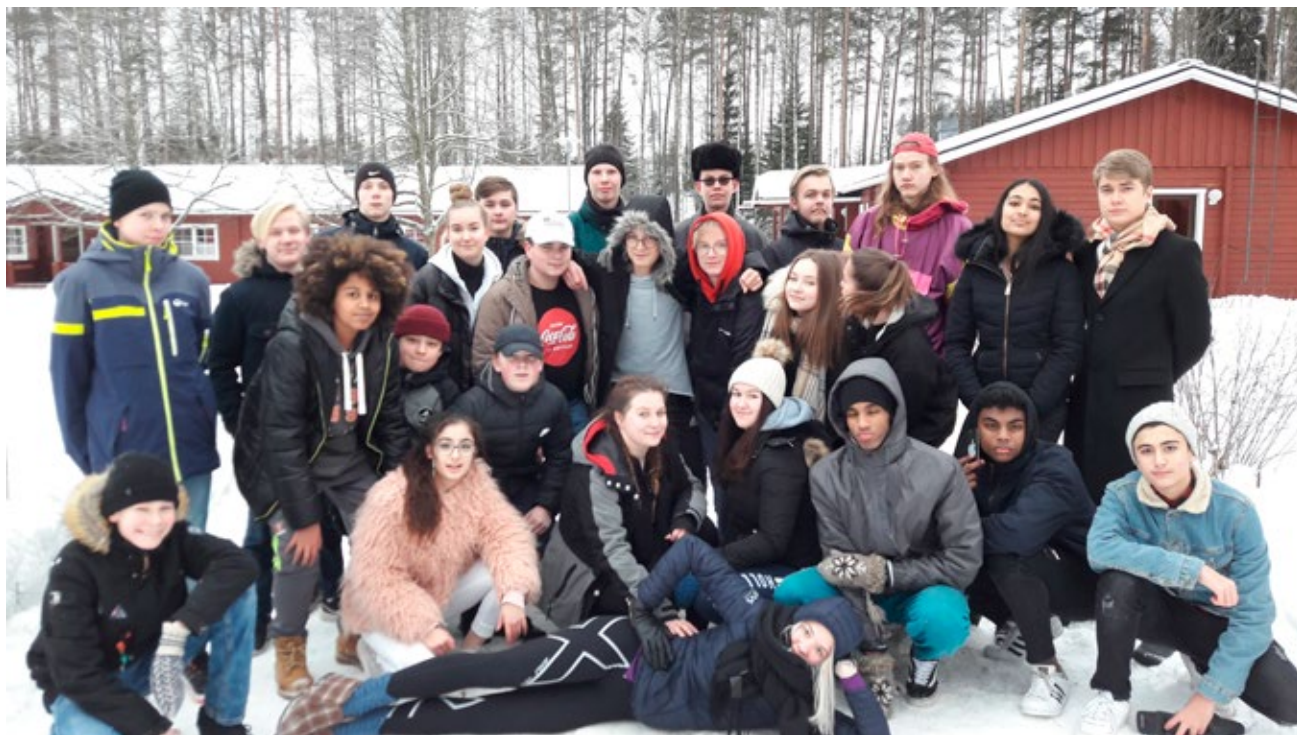
Vanda ungdomsfullmäktige 2018–2019.

Barn och unga kan påverka beslutsfattandet i staden bland annat genom ungdomsfullmäktige. Ungdomsfullmäktige är en påverkargrupp för ungdomar i åldern 13–18 år. Till ungdomsfullmäktige väljs vid val 20 ordinarie ledamöter och 10 ersättare för två år åt gången. Alla Vandabor i åldern 13–18 år har rätt att ställa upp som kandidat och rösta i valet. Ungdomsfullmäktige bevakar de ungas intressen och lyfter fram frågor som är viktiga för ungdomar.