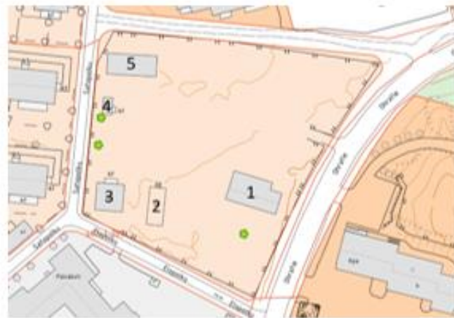
Olemassa olevat rakennukset (1-5) sekä arvopuut