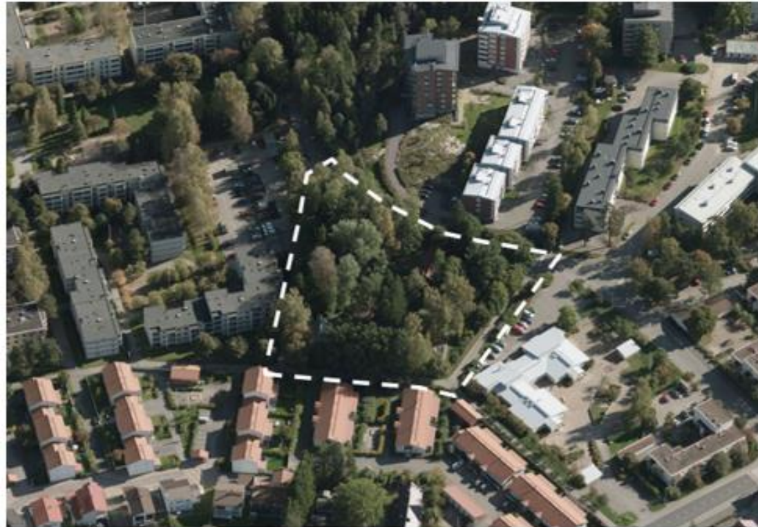
Ilmakuva kaavamuutosalueesta: viistokuva lännen suunnasta.