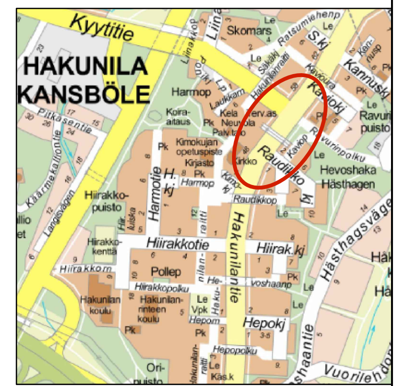
TYYPPIPOIKKILEIKKAUS A-A Hakunilantie välillä Kyytitie-Raudikkokuja