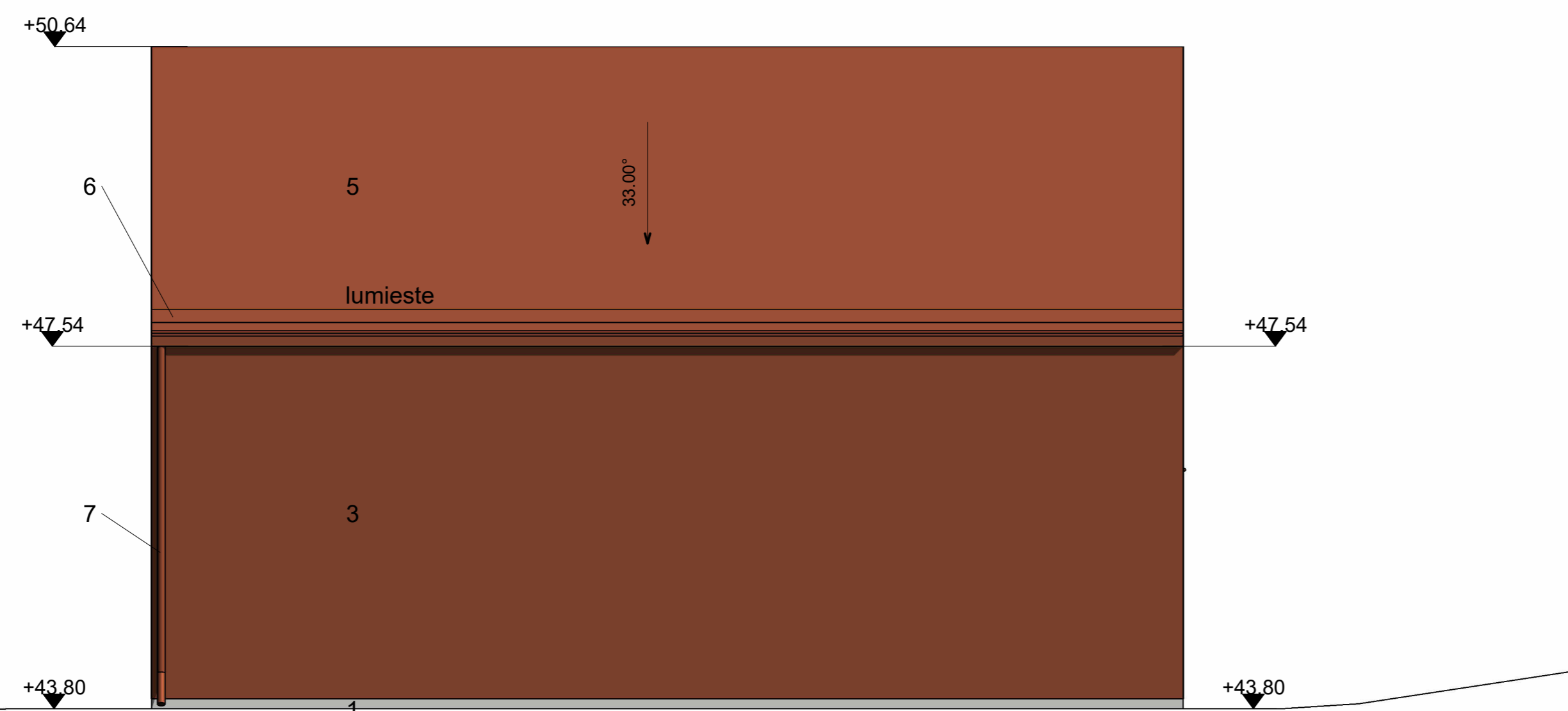
Julkisivu itään - 1/50