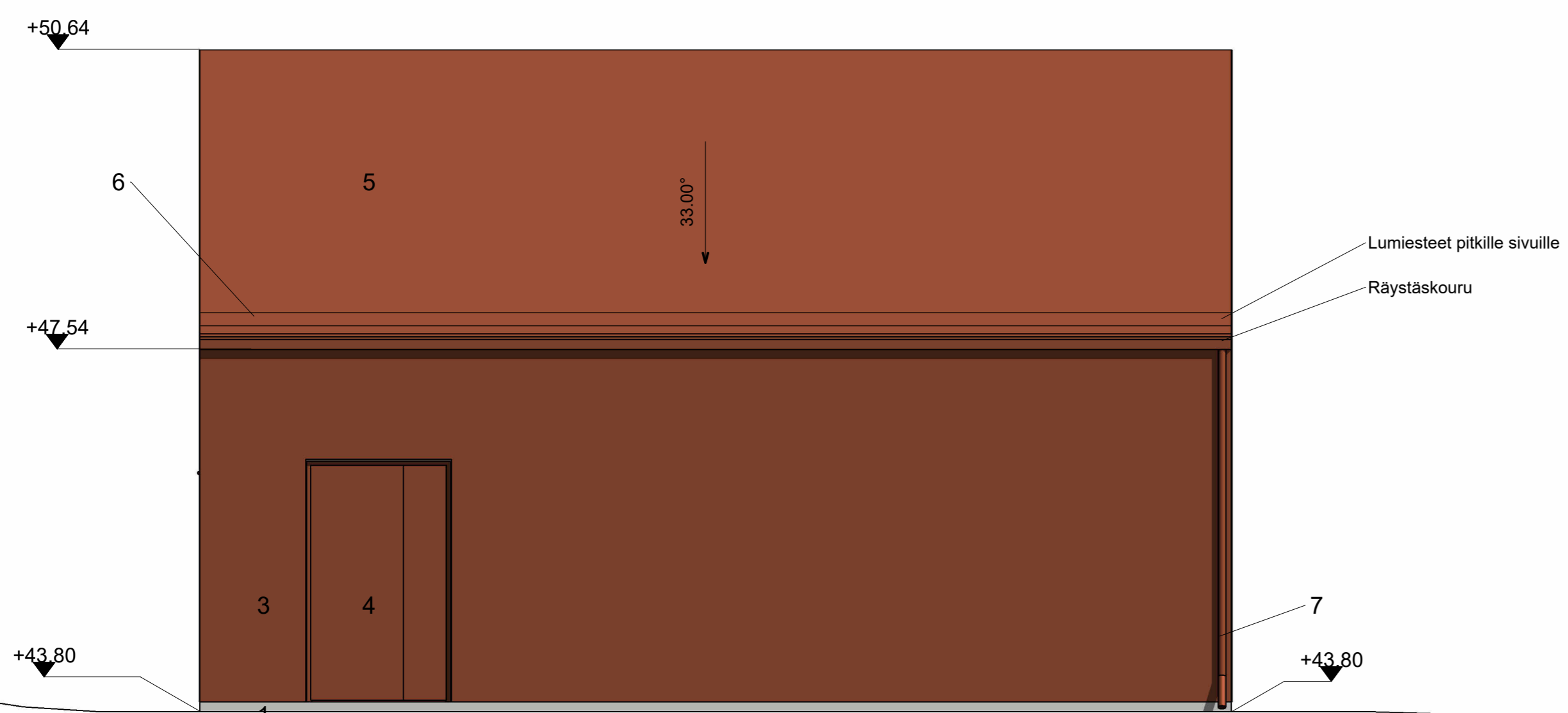
Julkisivu länteen - 1/50