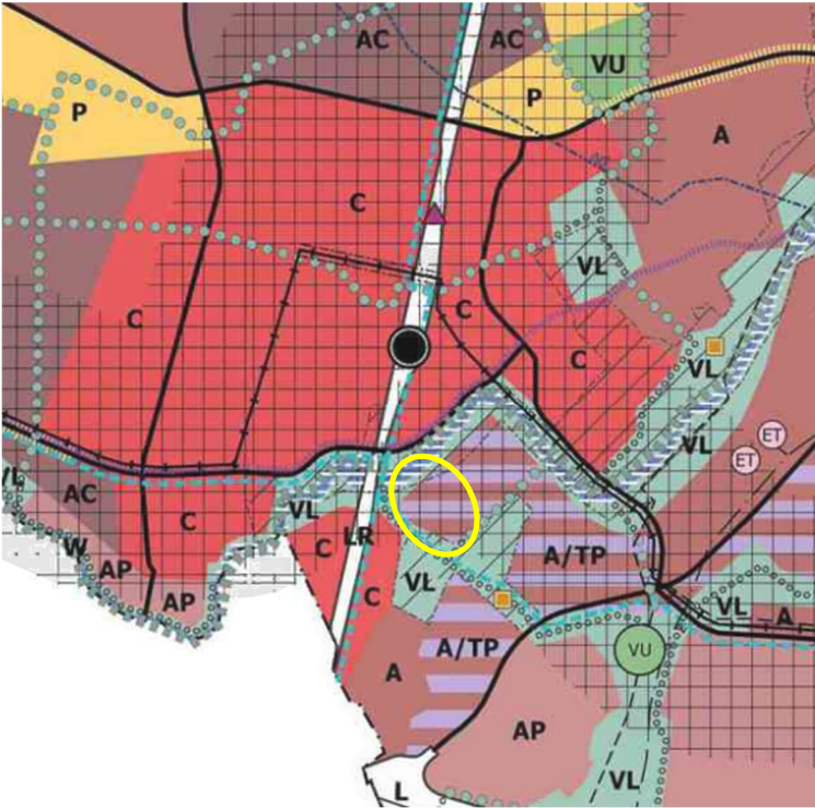
Kuvaote: Yleiskaava 2020 ja asemakaavamuutoksen suunnittelualue

Suunnittelualueen maanomistajat ovat Vantaan kaupunki ja Tikkurila Oyj.