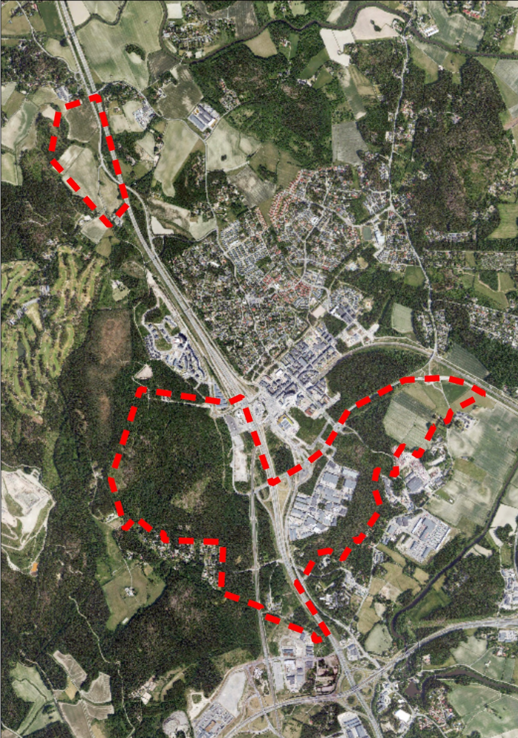
Ortoilmakuva. Kaava-alueen rajaus punaisella katkoviivalla.